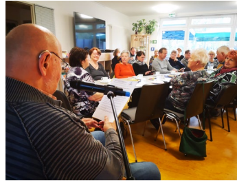
Kulturtage der Schwerhörigen in Thüringen