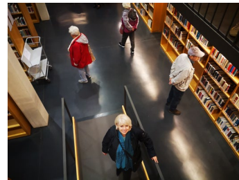
Besuch des Studienzentrums und Einkehr im inklusiven Samocca-Café