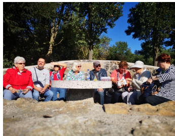
Spaziergang zu „Herders Ruh“